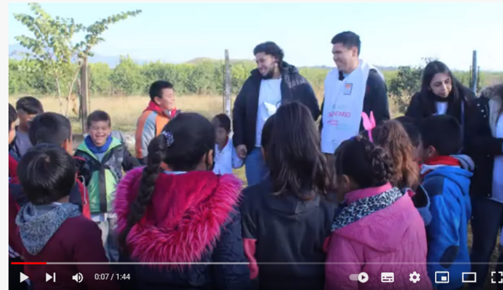
Fundación Vicente Lucci - Prácticas Profesionalizantes 2022 (Video)