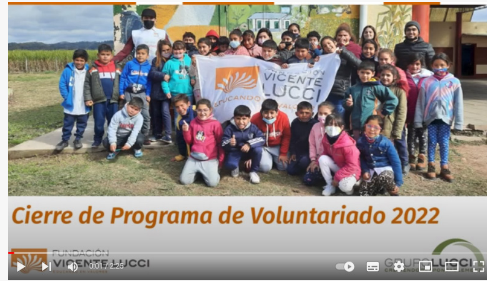
Fundación Vicente Lucci - Voluntarios 2022 (Video)