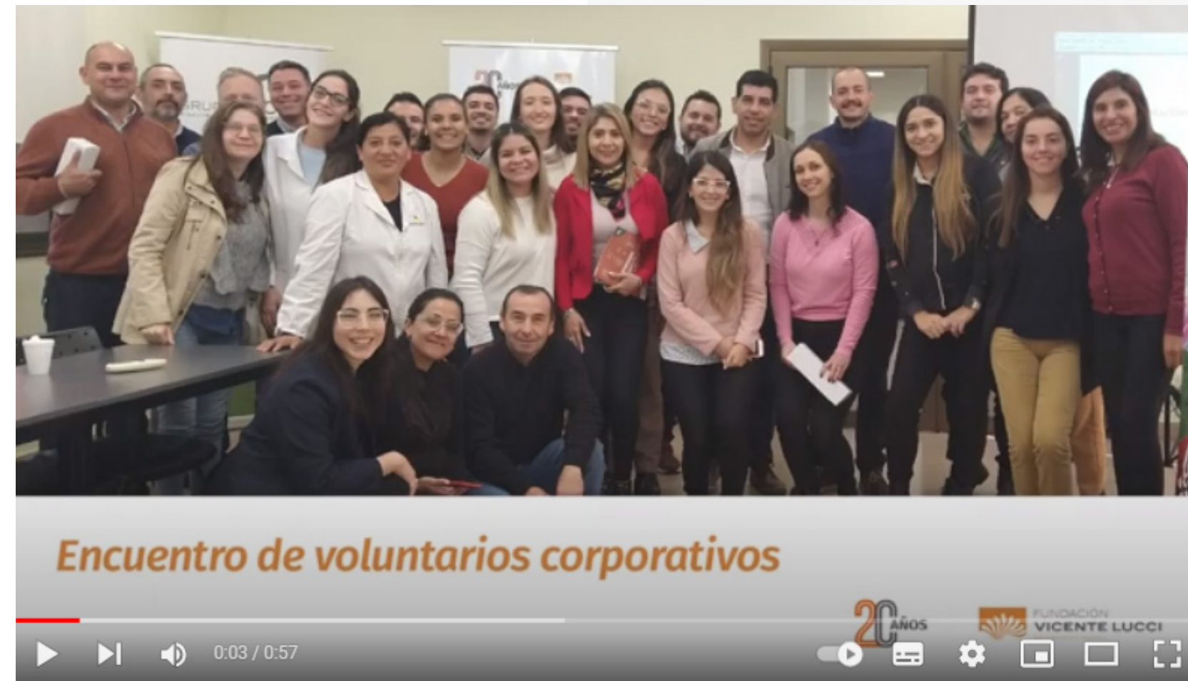
Encuentro de Voluntarios Corporativos (Video)