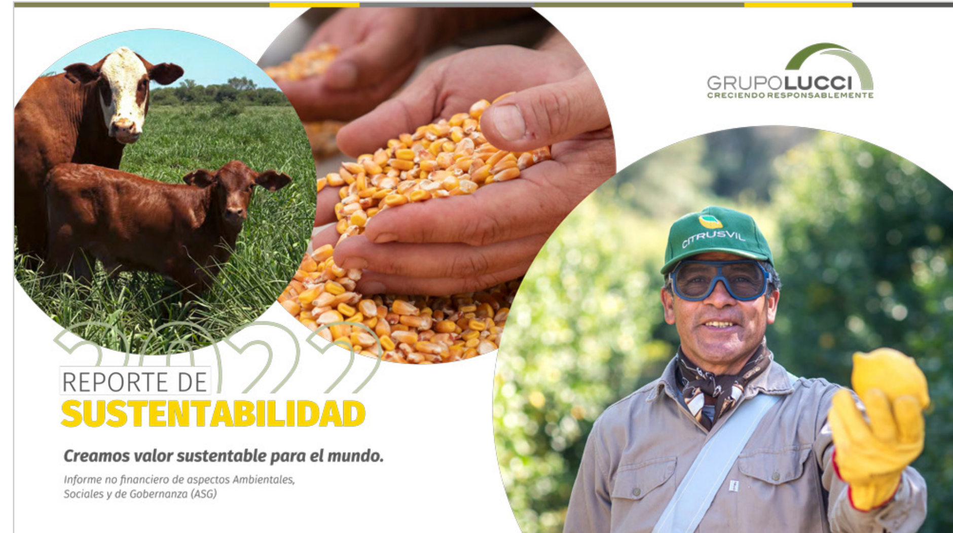
Reporte sustentabilidad (Link)