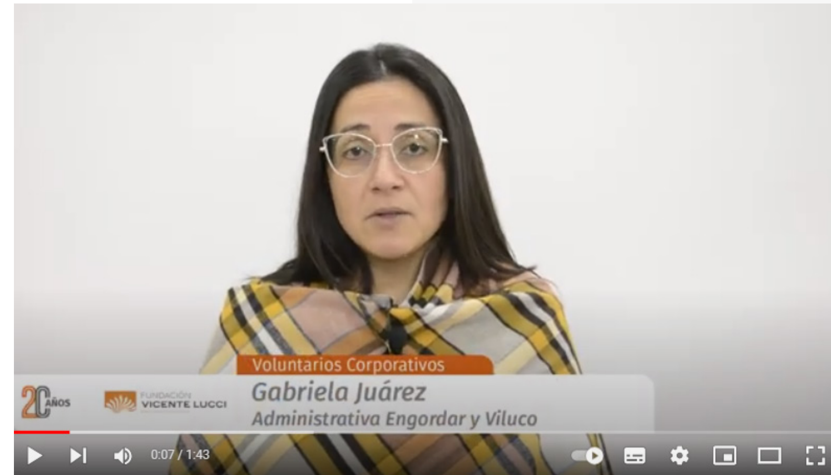
Fundación Vicente Lucci - El valor del voluntariado (Video)