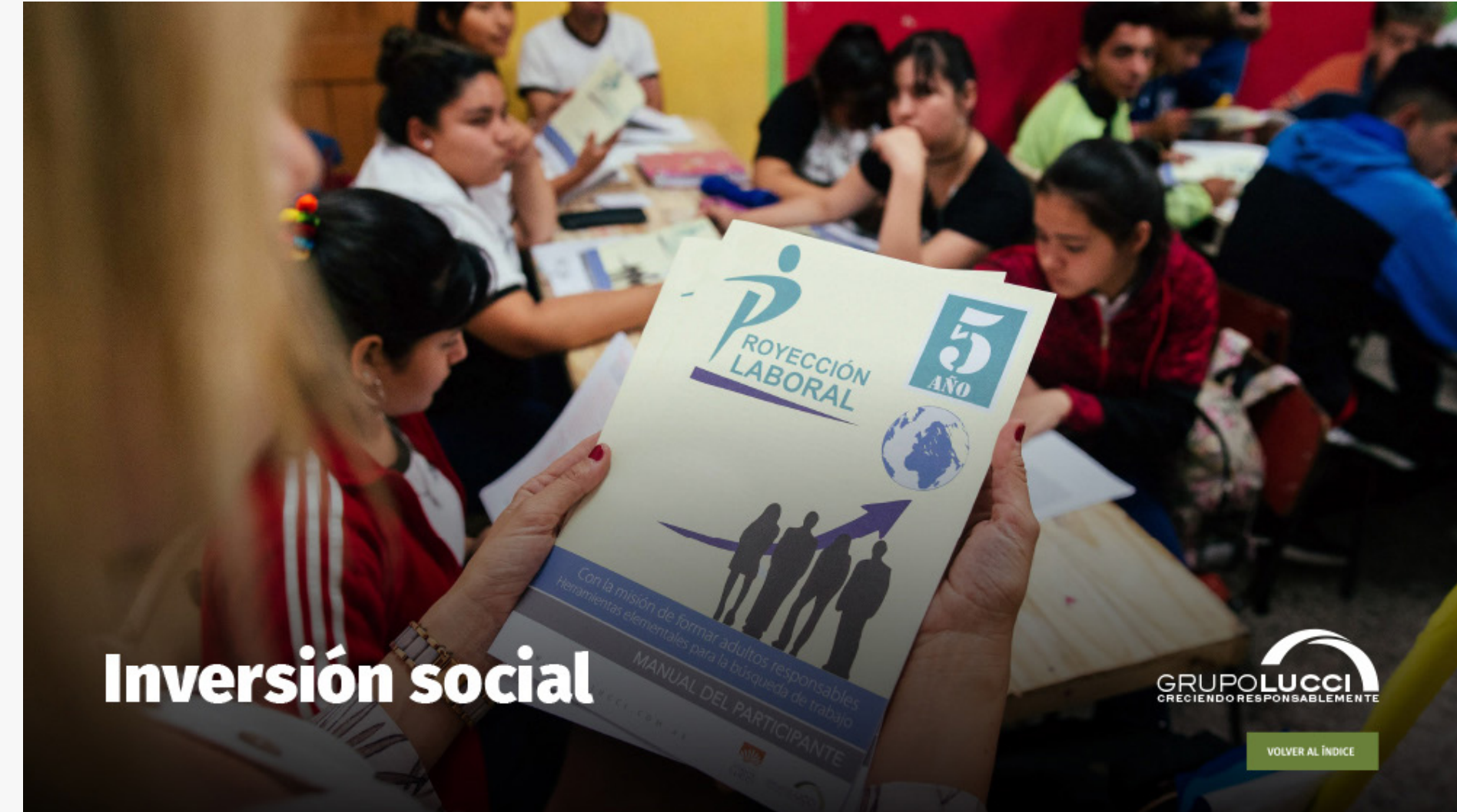
Inversión social (Link)